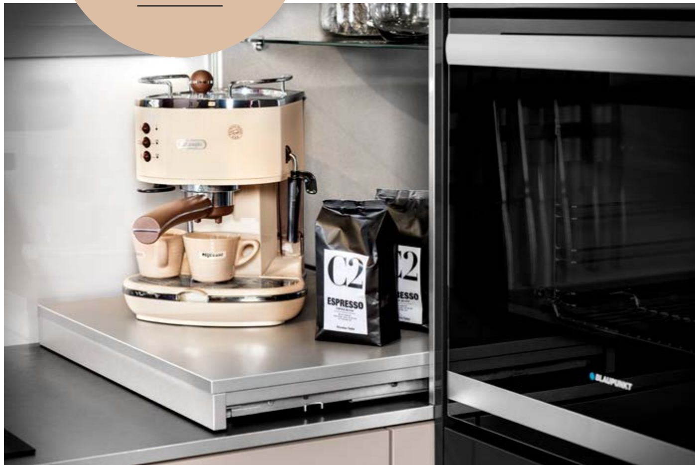
Rollladenschrank mit Tablarauszug

Der Auszugstablau wirkt gleichermaßen modern wie praktikabel.